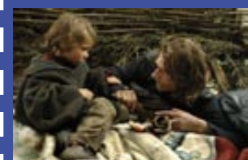
Hommage à Guillaume Depardieu : Versailles, un rôle prémonitoire p.16