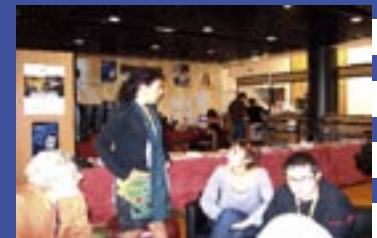
Des acteurs et réalisateurs très abordables au CINEMED p.4