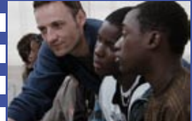
L'école : stade de match ou vase clos ? Entre les murs (L.Cantet) p.2