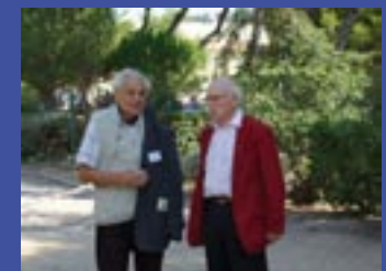
Deux pédiatres aux prises avec l'enfance et le cinéma vérité p.7