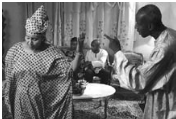
Il va pleuvoir sur Konakry