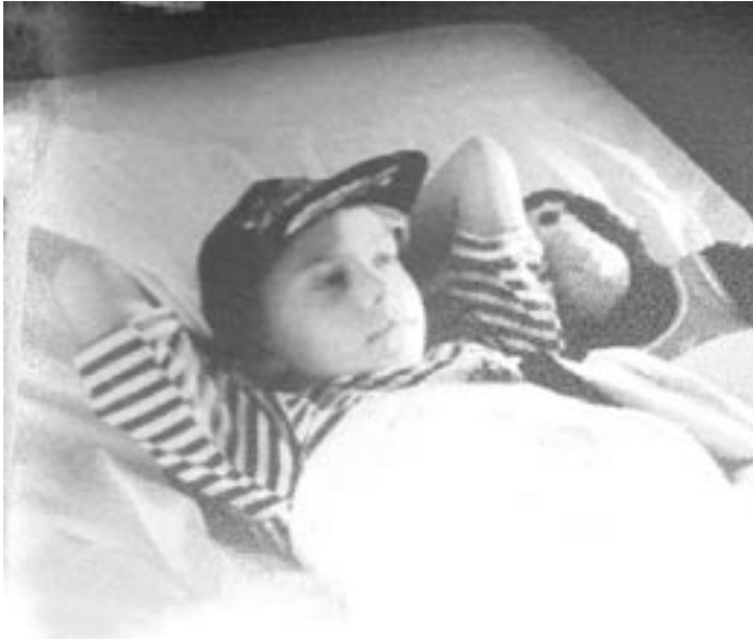
La vie est immense et pleine de dangers