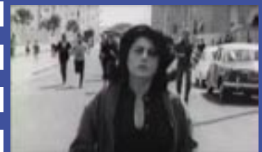
Les facettes de Pasolini et la virginité du regard : Mamma Roma p.13